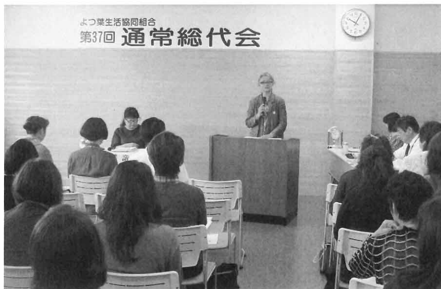
「2019年度 第37回 通常総代会のようす」

2020年度のテーマは「ひろげよう! よっ葉生協の輪 創ろう! 私たちの未来」。よっ葉の組合員が増え、よっ葉基準の商品を使う人が増えることが、未来の子どもたちの環境を守ることに