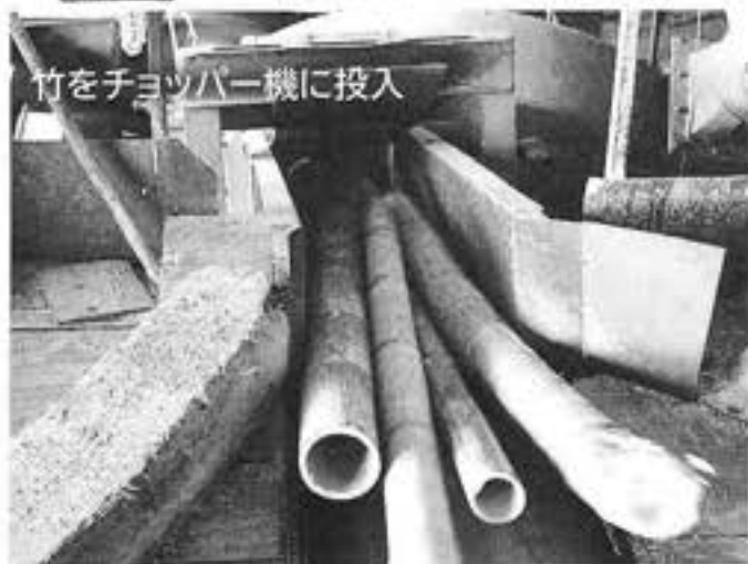
竹をチョッパー機に投入