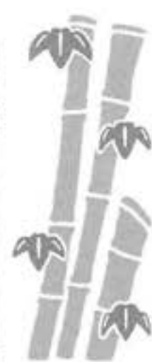
木材同様に、蒸解された竹チップの繊維は紙へ、残りは燃料として利用