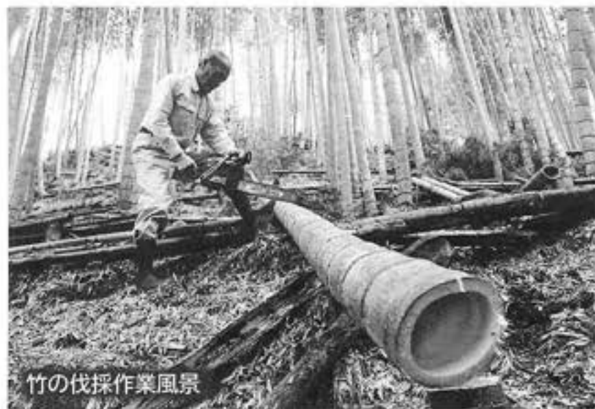
竹の伐採作業風景