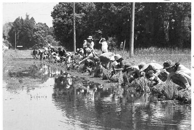
上三川農業体験 田植え