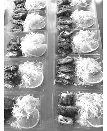
子どもの居場所「おひさま」の様子