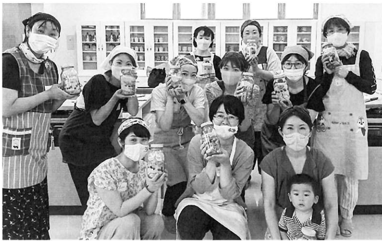
季節のフルーツを使って、シロップを作ろう