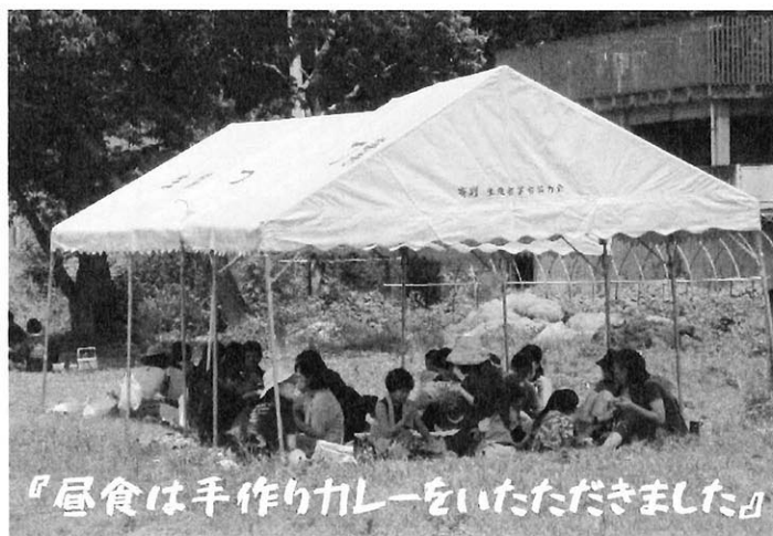
『昼食は手作りカレーをいただきました』