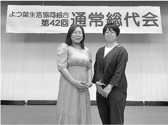
「退任しました ありがとうございます」

よつ葉生協がまだ、いばらきよつ葉生協とぐんまよつ葉生協と3つに分かれていた頃にいばらきよつ葉生協の理事として就任し、約22年間理事として活動させて頂きました。今では娘2人成人していますが、よつ葉と関わることで、子どもたちを幼いころから安心安全で貴重な食材で育てられたことはこの上なくありがたいことです。活動を通してたくさんの素晴らしい信念を持った方々に触れる機会や出会いと学びがあったこと、宝物のような時間を過ごすことが出来ました。よつ葉カフェ・毎年行っていたおまつりなどでたくさんの方々と一体となった活動がとても楽しく、貴重な体験でした。関わった全ての方へ、感謝の気持ちでいっぱいです。 (針谷光絵)