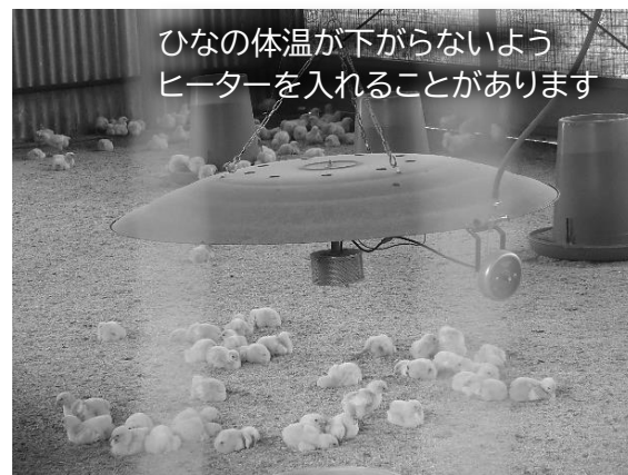
ひなの体温が下がらないようヒーターを入れることがあります