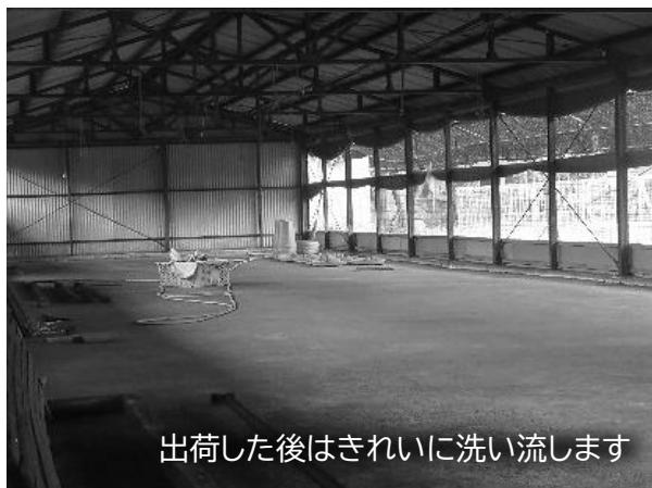
出荷した後はきれいに洗い流します