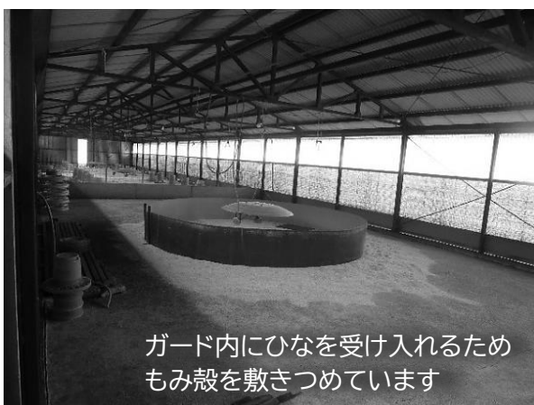
ガード内にひなを受け入れるためもみ殻を敷きつめています