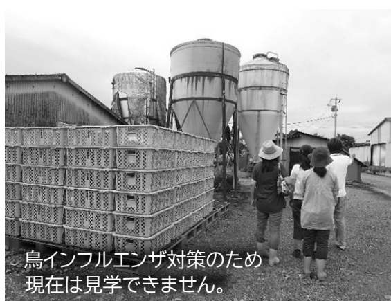
鳥インフルエンザ対策のため現在は見学できません。