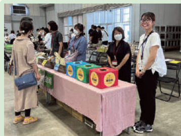
栃木県エリア マルシェ

各地域でお店を営んでいる方達とのコラボ企画 お店だけの出店ではなく、組合員さんの手作り品や ワークショップ体験も行っています。