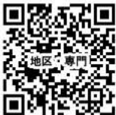
お申込み QR コード